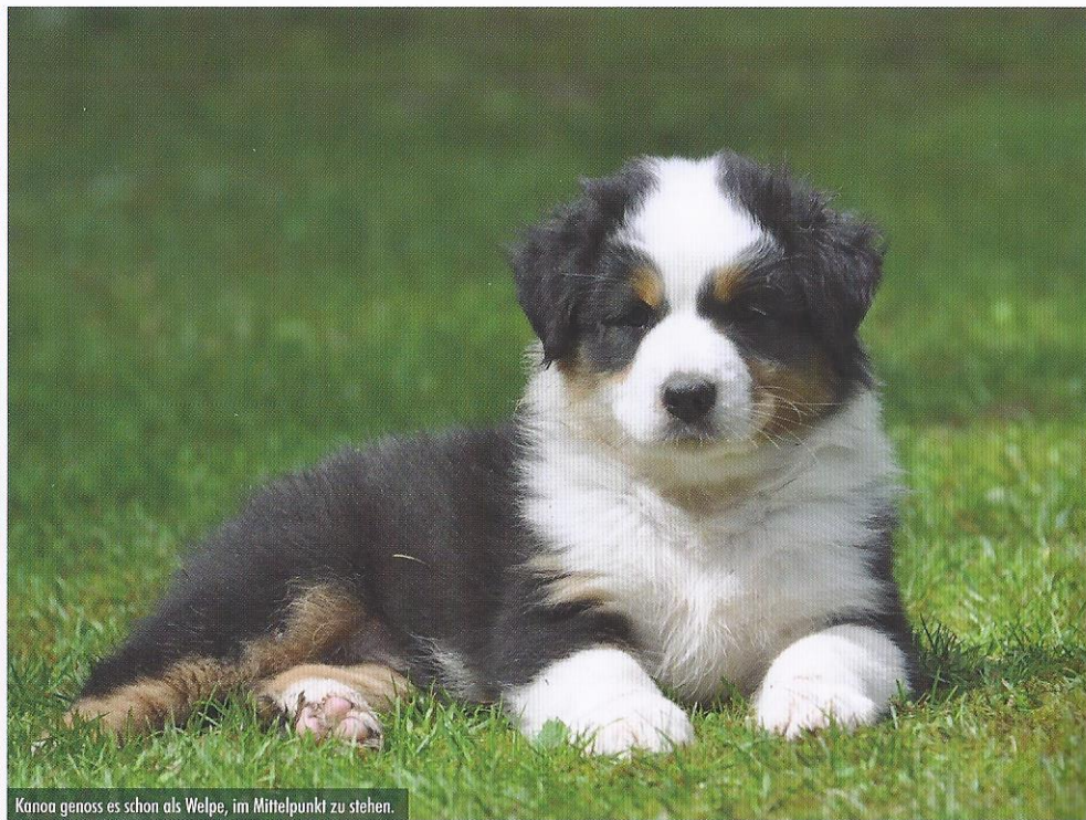
Kanoa genoss es schon als Welpe, im Mittelpunkt zu stehen.

gesundheitliche Untersuchungen als durch den Verband vorgeschrieben werden. Ein Prinzip steht jedoch über allem: die ethische Verpflichtung unsern Hunden gegenüber! Wer einzieht, bleibt bis an sein Lebensende. Bei uns wird kein Hund, weil er für die Zucht ungeeignet oder alt geworden ist, abgegeben“, unterstreicht Claudia Bosselmann.